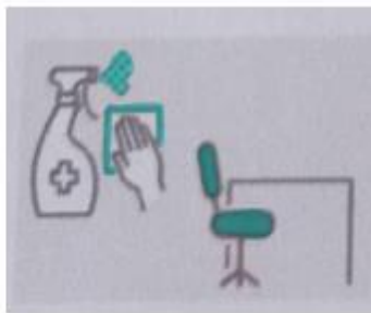
Sanitización y limpieza.