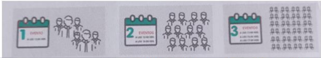
Primeras semanas, podrá realizarse un evento al día con grupos reducidos.

Los eventos podrán realizarse cuando el semáforo establecido por las autoridades del municipio se encuentre en verde, de acuerdo las siguientes consideraciones.